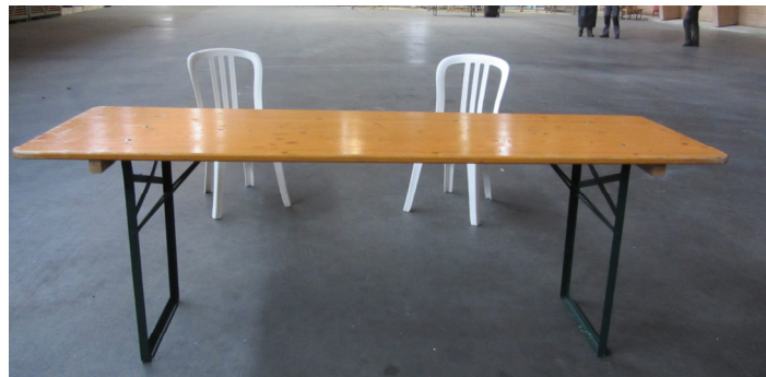
Festtisch mit 2 Kunststoff-Stühlen (allfällige Tischabdeckungen erfolgen durch die Aussteller)